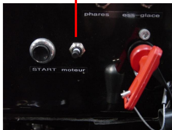
Motor of ignition knop

Het is dus aangeraden om tijdens de rijderwissel de motor (ignition) of uit te schakelen - tot de stilstand van de motor - om deze vervolgens weer aan te zetten. Dit laat de diesellooppomp en de pomp voor de koeling van de intercooler toe om de vloeistoffen verder te laten circuleren, wat de herstart zal vergemakkelijken.